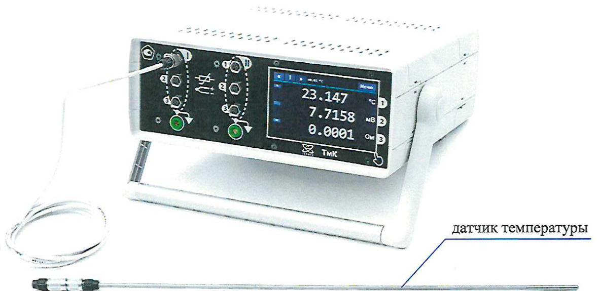
Рисунок 2 — Внешний вид термометра ТмК-12 (с двумя измерительными модулями и датчиком температуры)