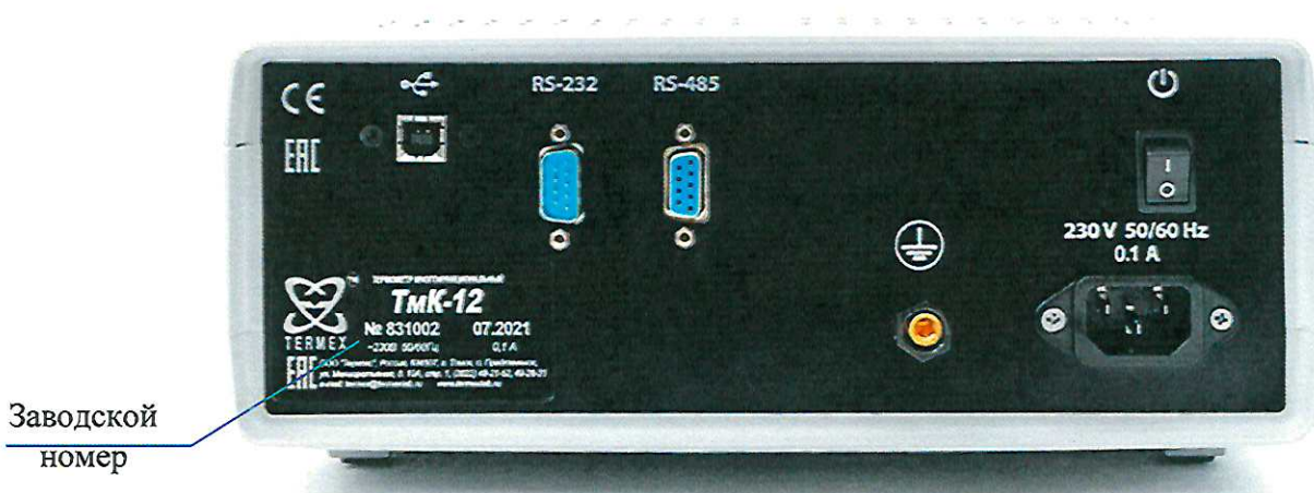
Рисунок 4 — Внешний вид термометров сзади, с указанием места расположения заводского номера

Пломбирование термометров не предусмотрено.