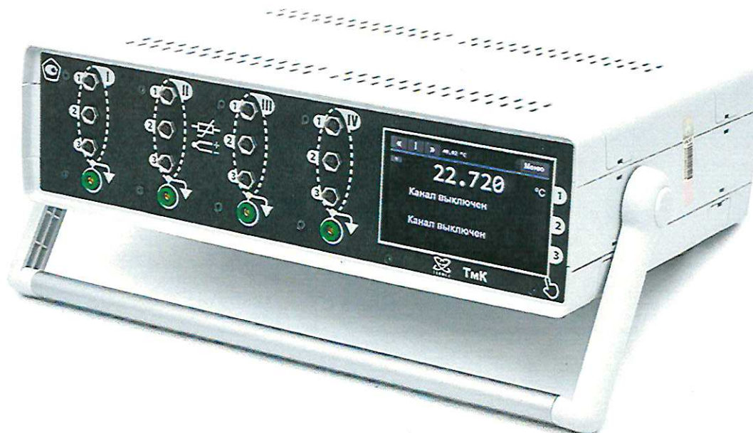
Рисунок 3 — Внешний вид термометра ТМК-04 (с четырьмя измерительными модулями)