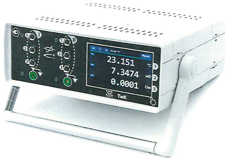
Рисунок 1 — Внешний вид термометра ТмК-02 (с двумя измерительными модулями)

Фотографии общего вида термометров представлены на рисунках 1-4.